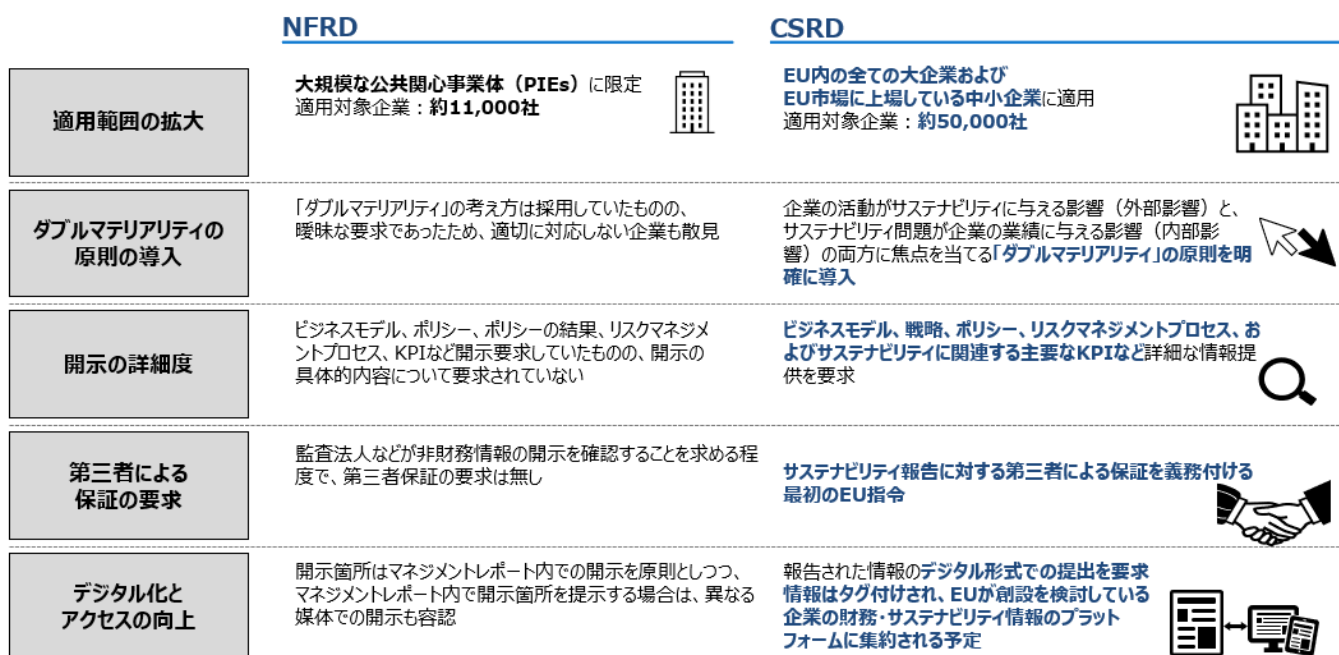
【図 2】NFRD と比較した CSRD の特徴