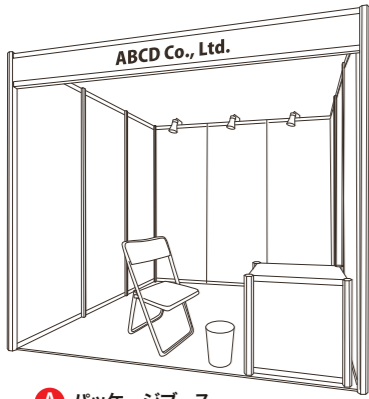
A パッケージブース (最小12m)