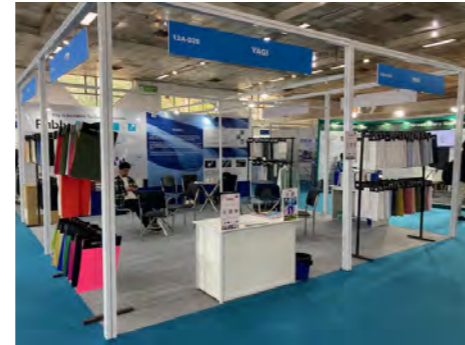
展示例(4小間) レンタル備品・展示パネル等の装飾は別途料金となります。