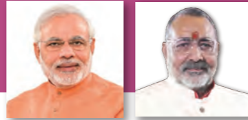
インド首相：ナレンドラ・モディ インド繊維省大臣：シュリ・ギラージ・シン